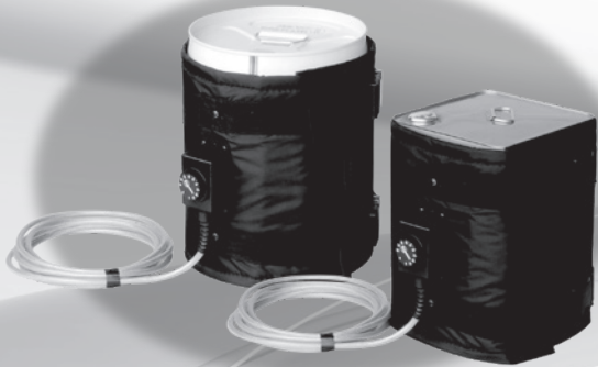
HTJ-A-P 20ℓペール缶 / 18ℓ一斗缶用